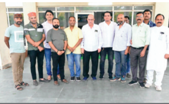
फुटपाथ पर व्यवसाय करने वालों को स्थान देने की मांग