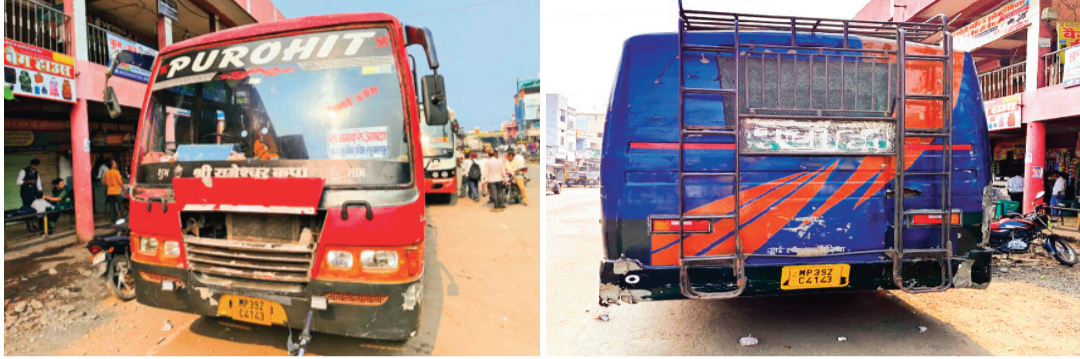
कुछ कर्मचारियों की मिलीभगत की आशंका भी जताई जा रही है।